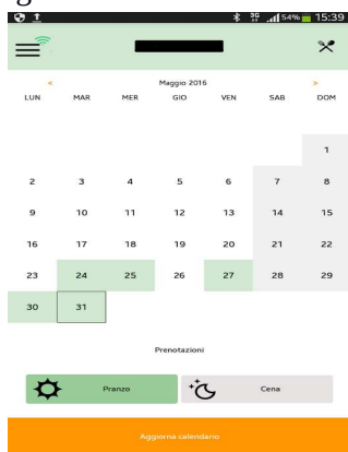
(visualizzazione giornate prenotazione pasto)