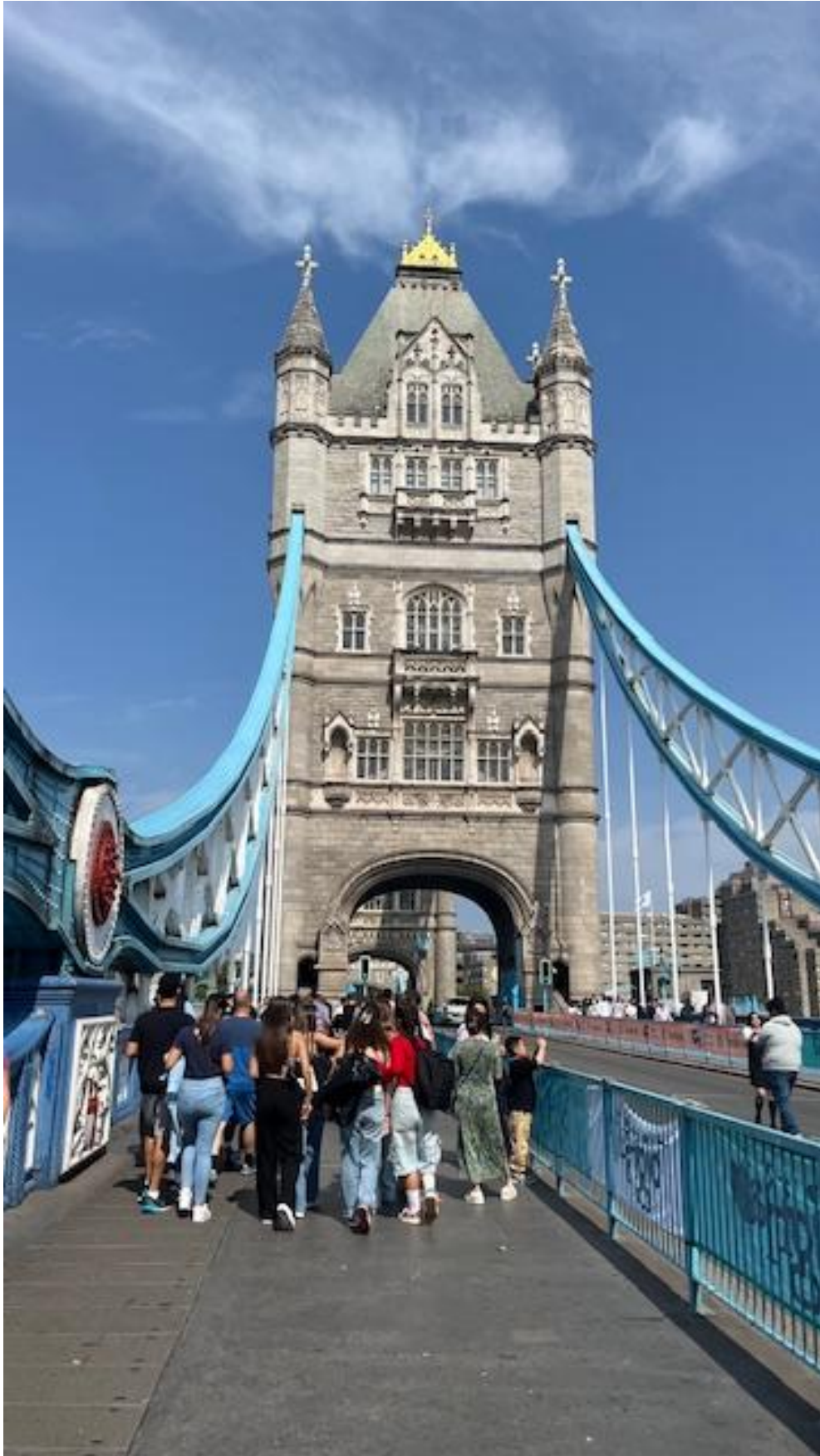
Viaggio a Londra, estate 2024