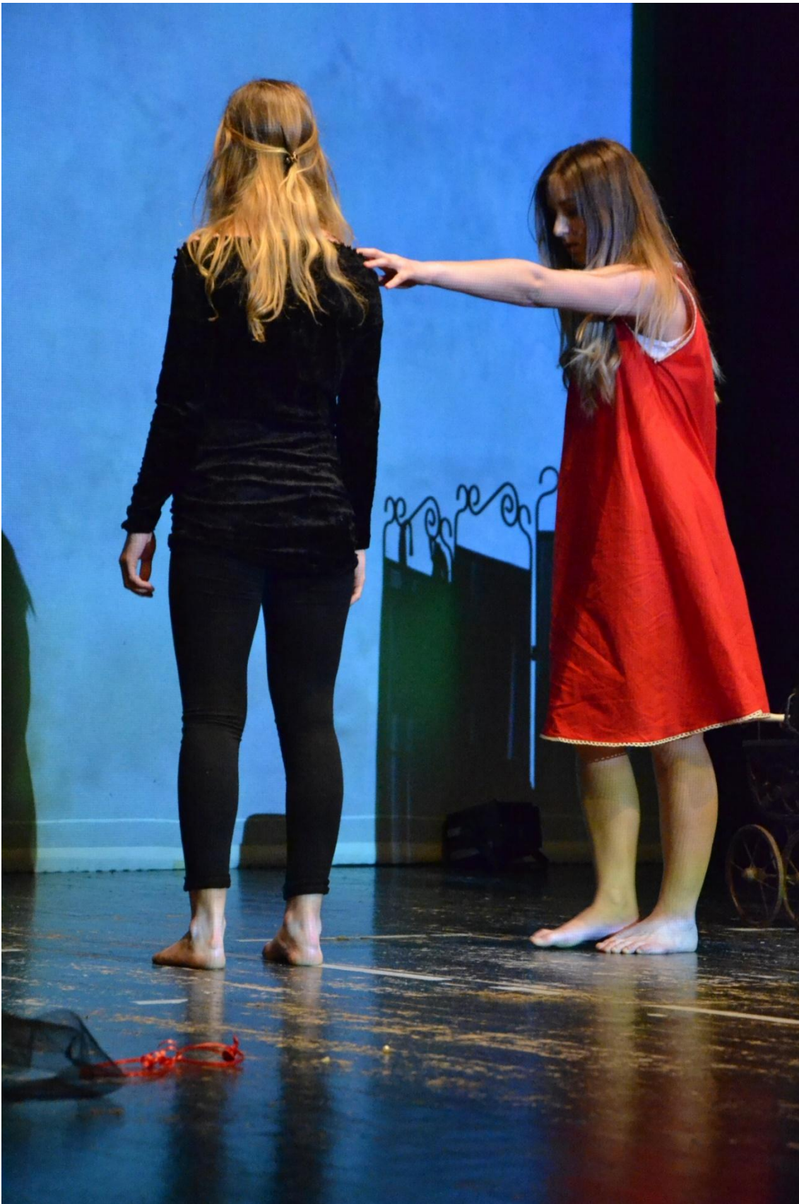
Spettacolo teatrale "Une femme, un univers", maggio 201