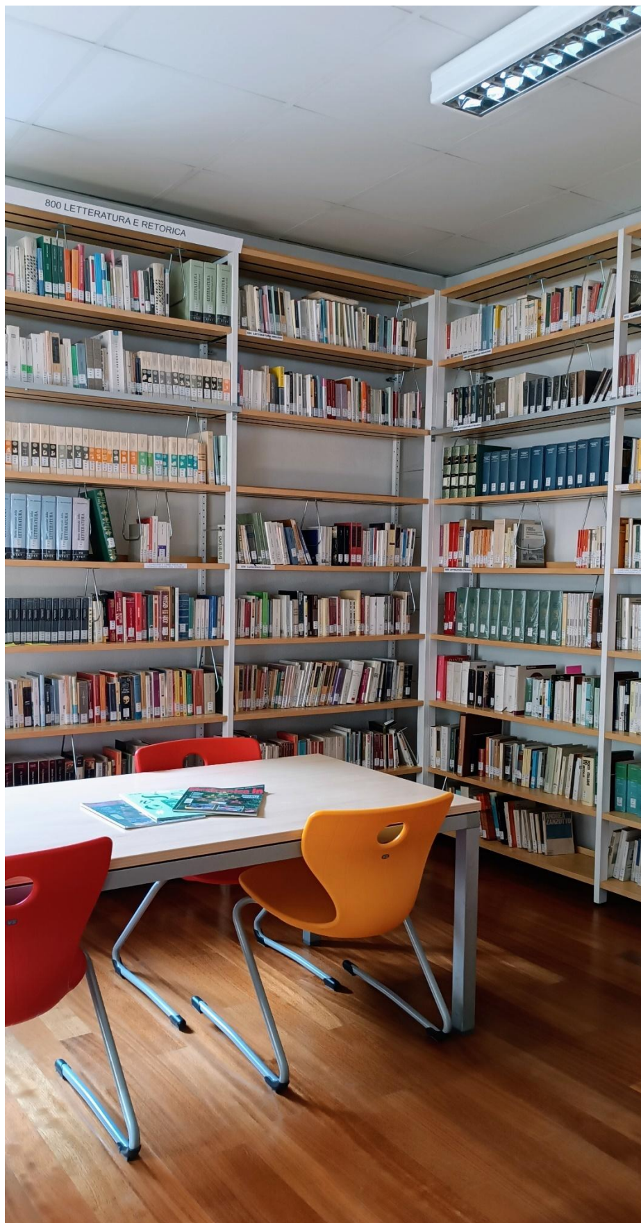
La Biblioteca dell'Istituto Tambosi