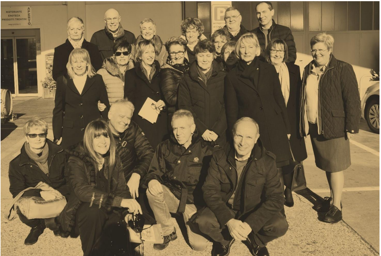
La classe 5E oggi