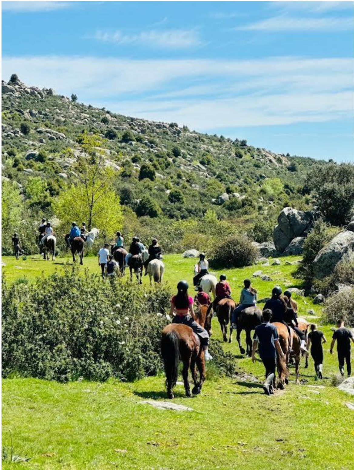
Esperienza in Spagna, 2024