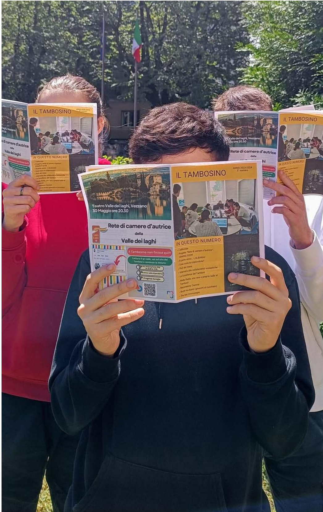
Redattori e lettori del Tambosino