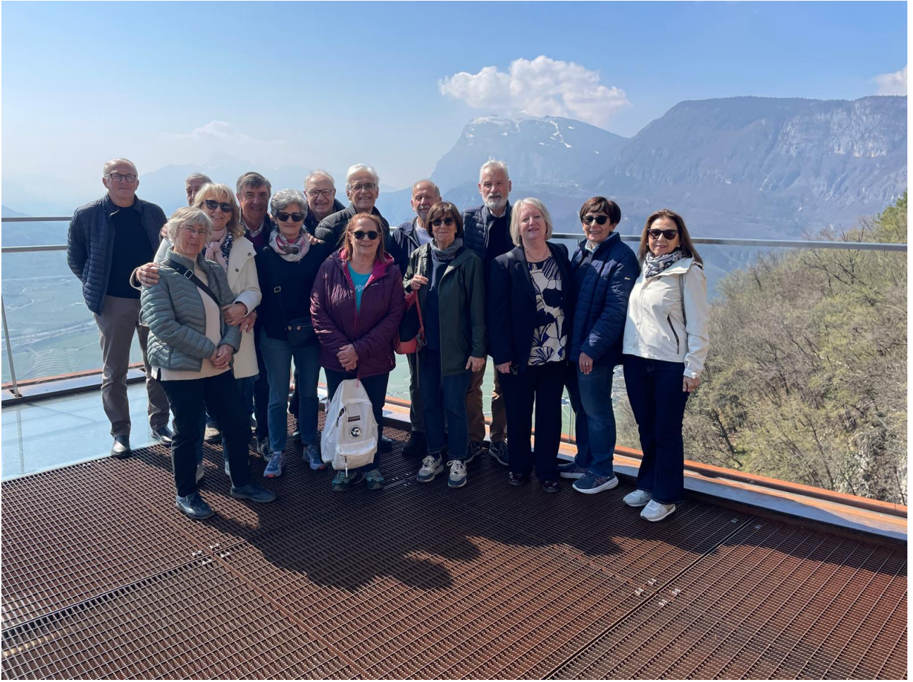
Classe 5D oggi