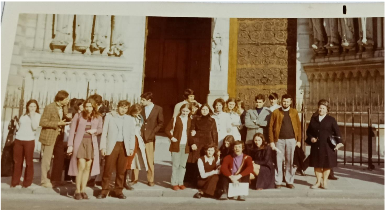
Parigi, gita scolastica, 1971