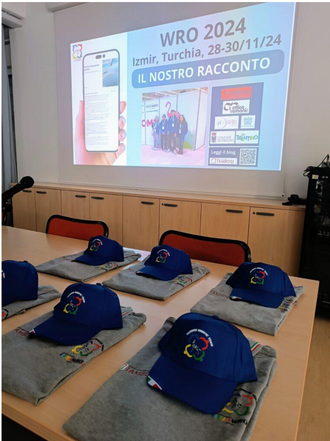
Novembre 2025, presentazione dell'esperienza WRO in Turchia