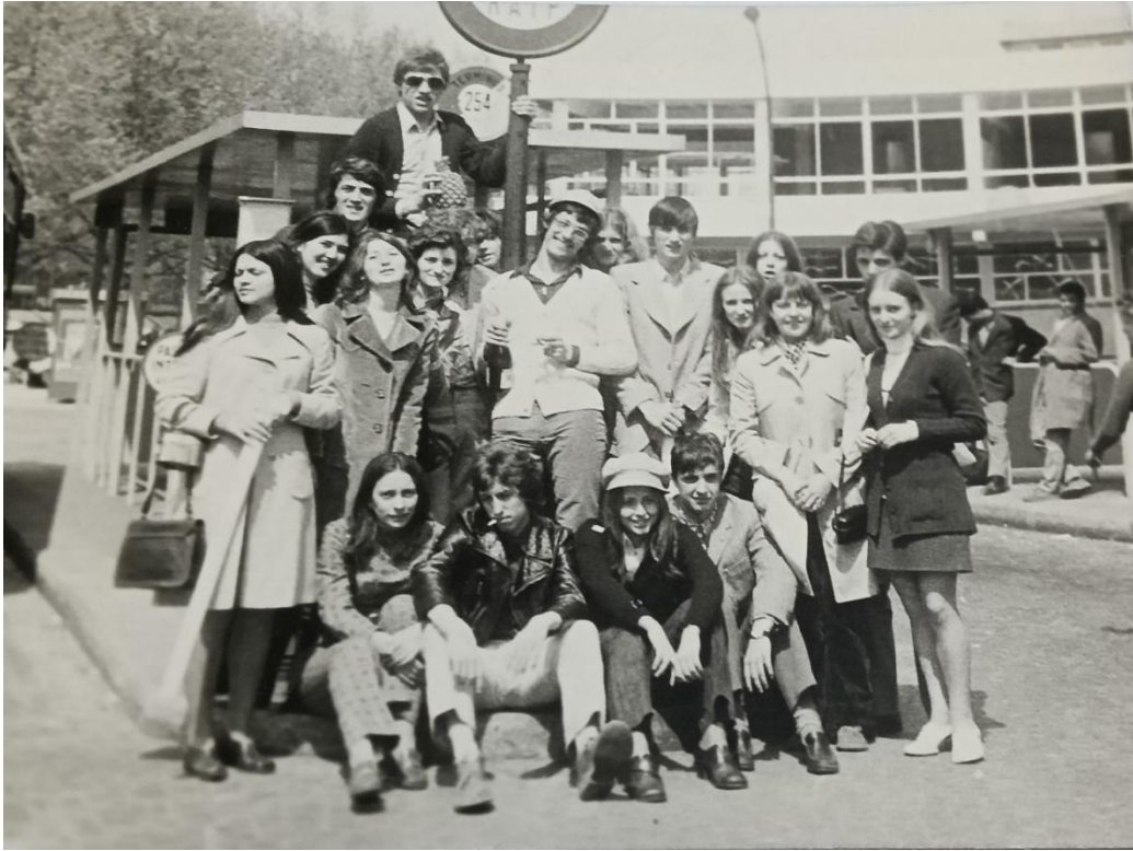
Parigi, gita scolastica, 1971