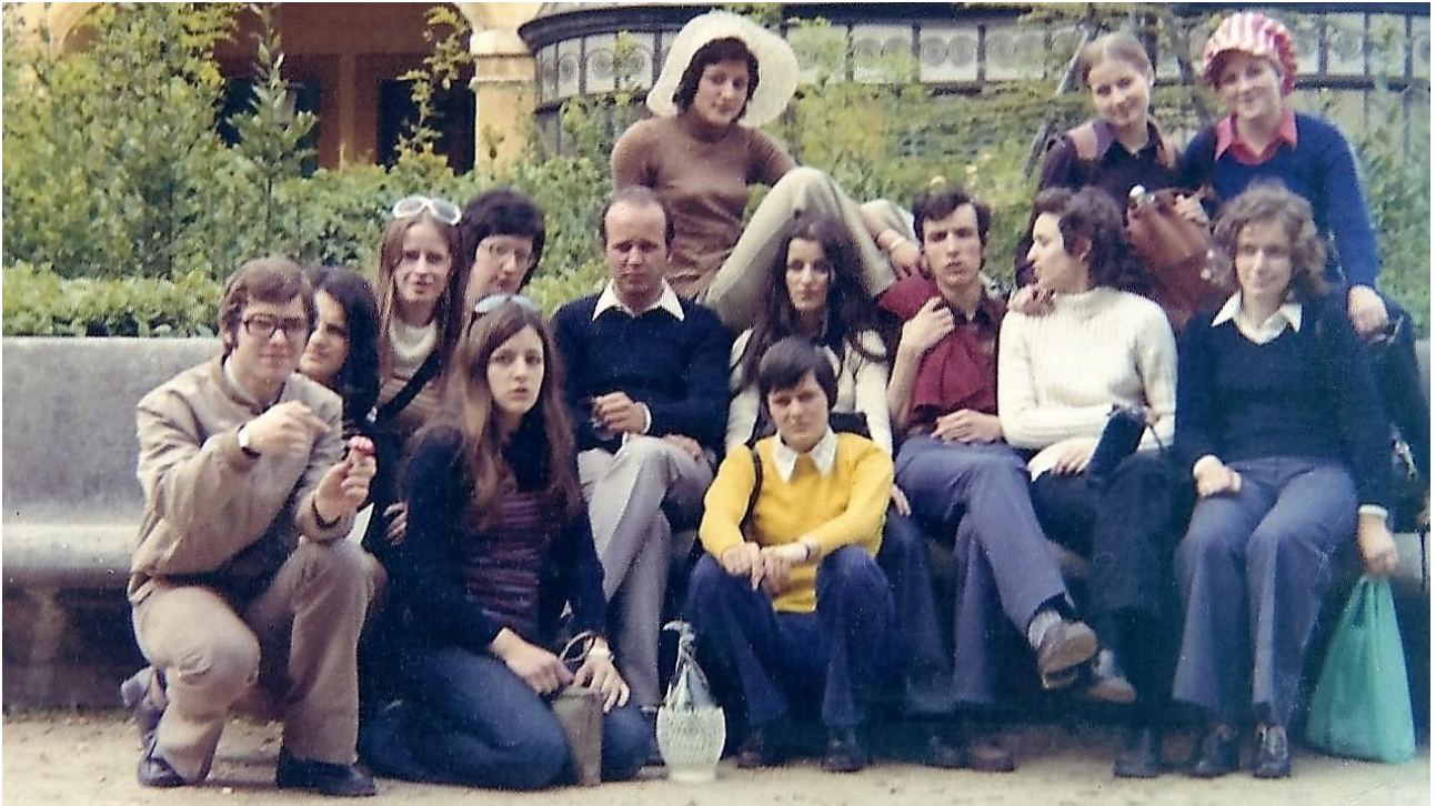
Gita a Firenze