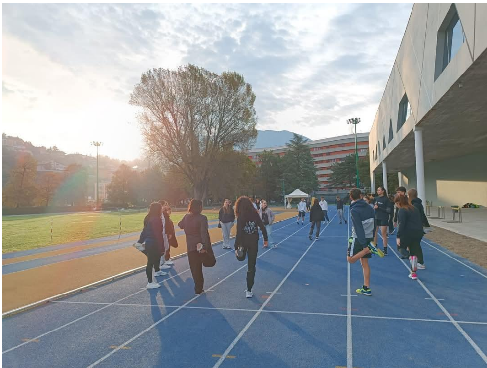
Test a Campo Coni, Trento, 2024