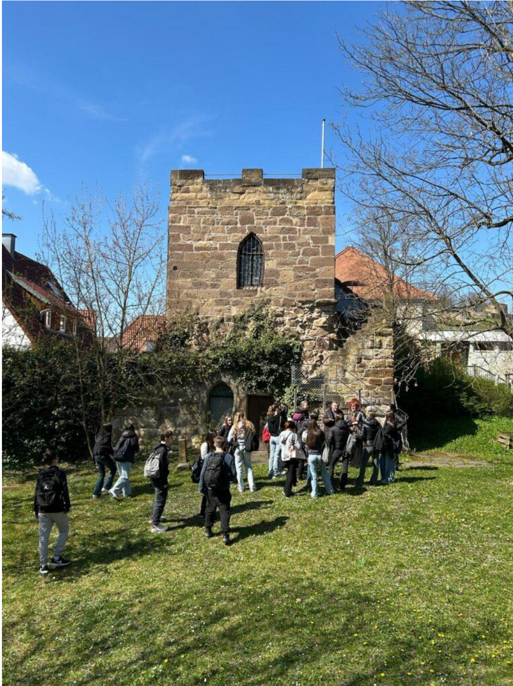
2025, viaggio a Weinsberg

Nel 150° anniversario della nostra scuola, celebriamo anche questa trasformazione: da istituto economico a crocevia di lingue, culture e opportunità. Perché il futuro si costruisce viaggiando e il Tambosi (grazie al lavoro costante dei docenti del Dipartimento di Lingue – Inglese, Tedesco e Spagnolo – insieme alla parte amministrativa e organizzativa della scuola) continua ad ampliare la sua proposta di esperienze, viaggi e studio. Perché ogni aula può essere una finestra sul mondo.