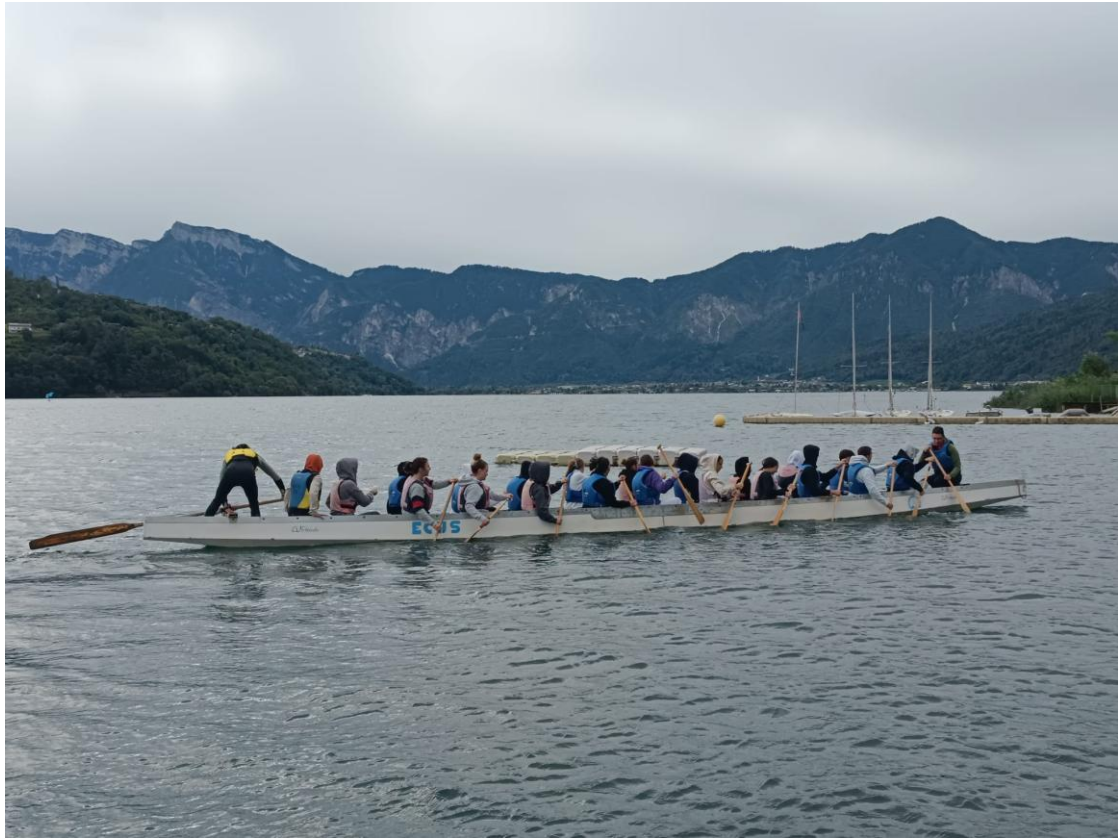
Attività al Lago di Caldonazzo, 2024