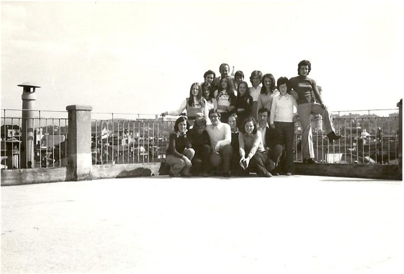
Gita a Firenze