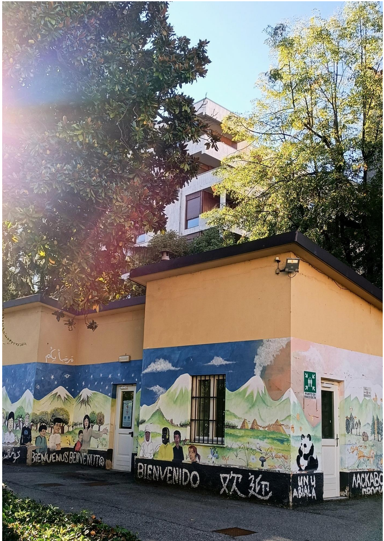
Laboratorio L2 – “la casetta”