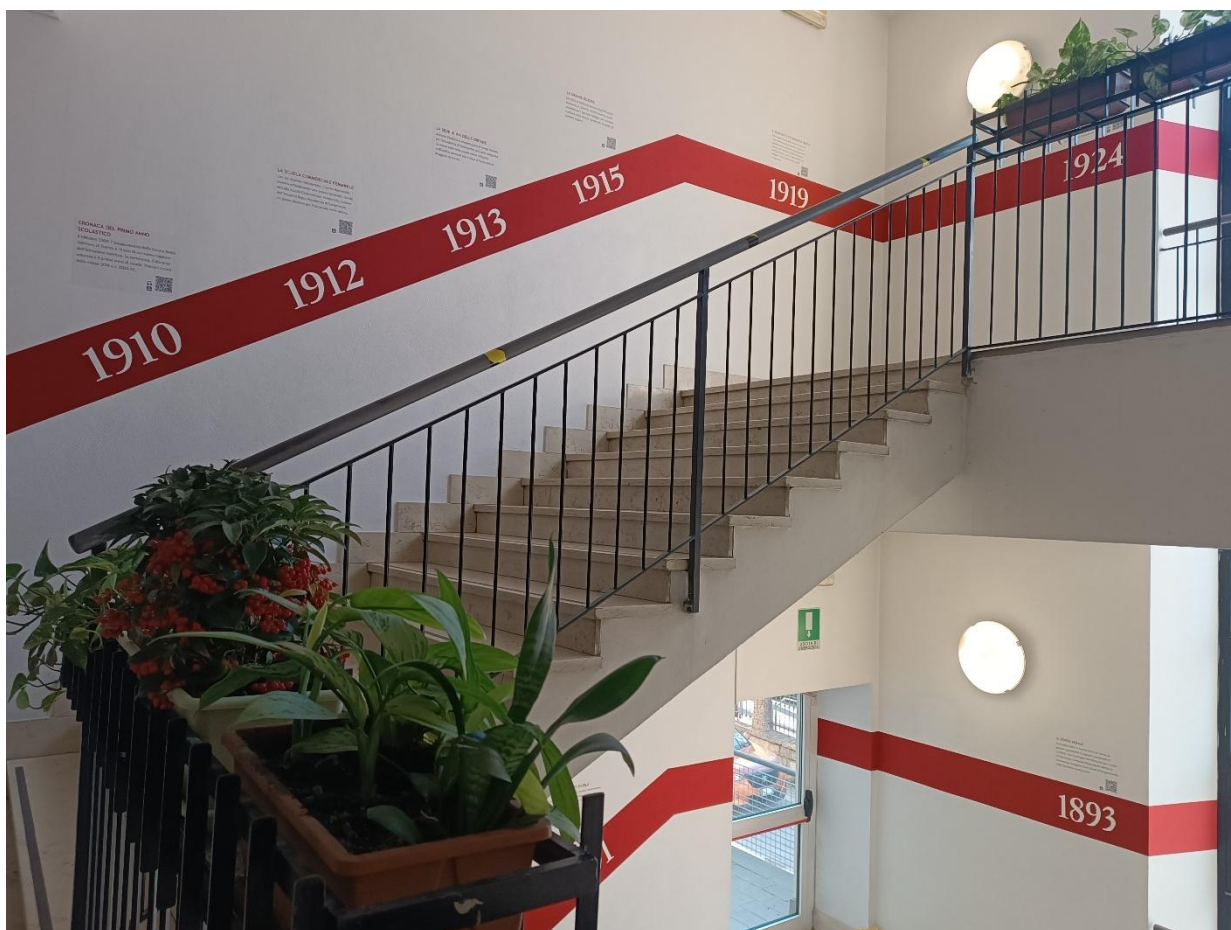
Sopra: la timeline. Sotto: momento di registrazione