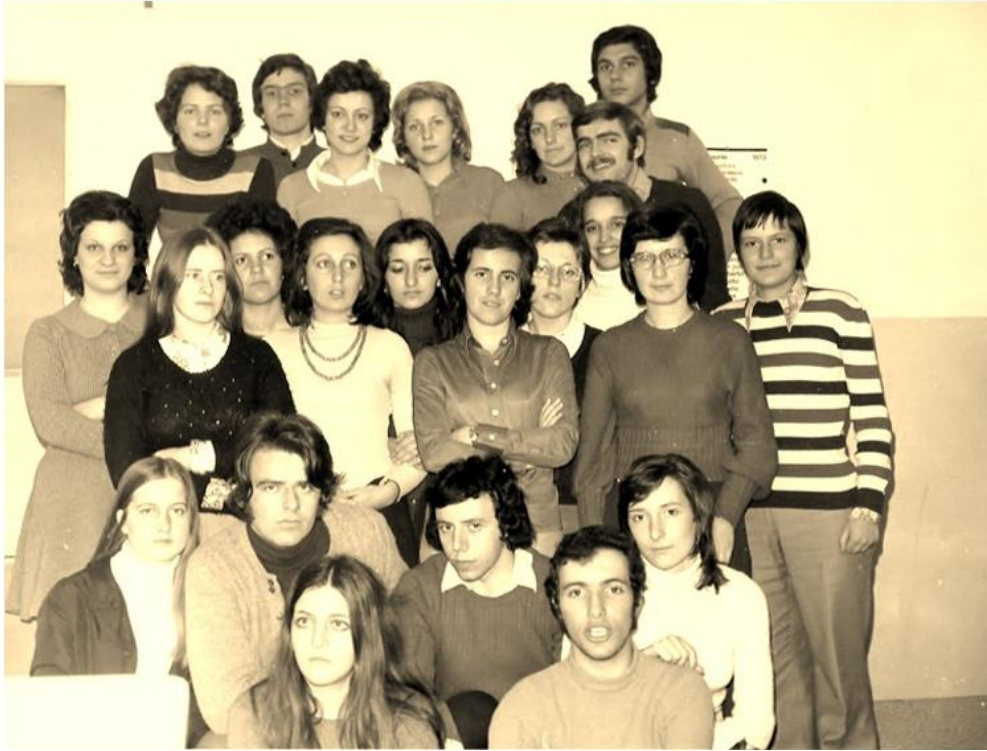
Foto di classe al Tambosi